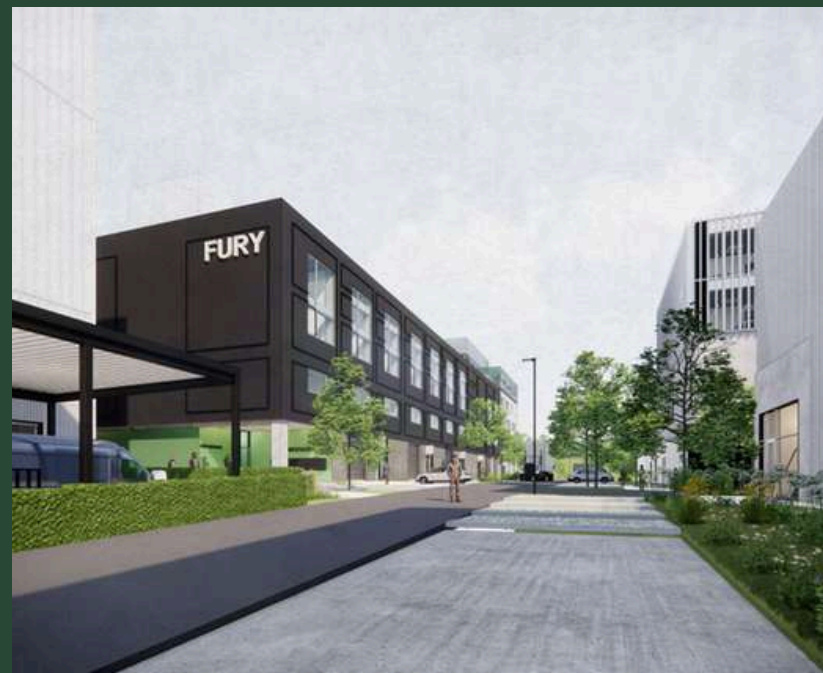
Zicht vanuit bedrijvenpark op voorgevel gebouw H