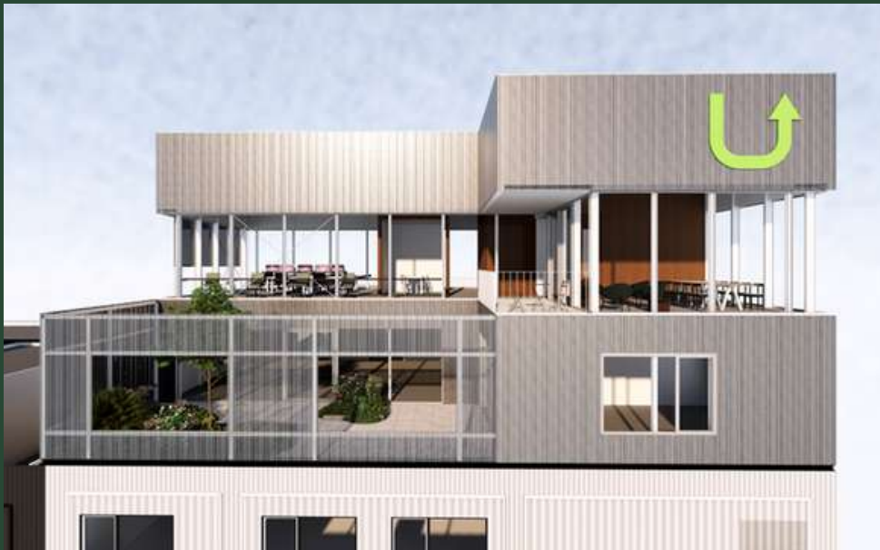
Oostgevel gebouw H2 (niveau 4 en 5)