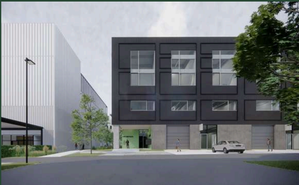
Zicht vanuit bedrijvenpark op voorgevel gebouw H2, hoofdingang naar trappenhal