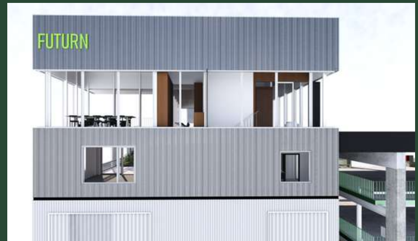
Noordgevel gebouw H2 en verbinding parkeergebouw