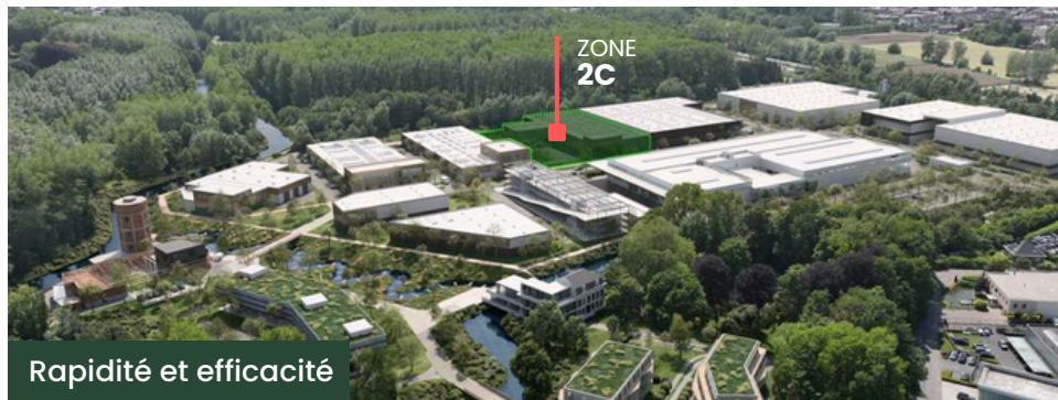
Exemple de volumétrie et de matériaux mis en oeuvre

Les deux bâtiments peuvent être acquis séparément ou ensemble. Idéal pour les entreprises à la recherche d'une nouvelle base opérationnelle à court terme (1 an) sur un site exceptionnel.